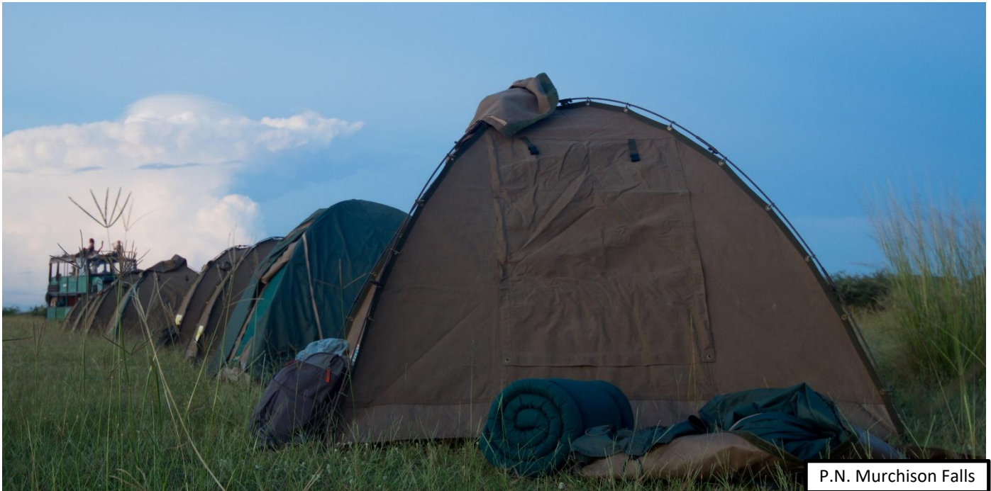
P.N. Murchison Falls

En las noches de campamento y acampada libre haremos un buen fuego mientras montamos las tiendas de campaña alrededor. Las puestas de sol de África, en medio de impresionantes y silenciosos escenarios naturales y la posterior cena y charla alrededor del fuego, crearán momentos mágicos e inolvidables.