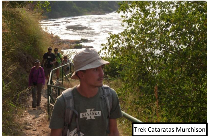
Trek Cataratas Murchison

- Cataratas Murchison: La caminata en el Top of the Falls es fácil, corta y accesible para todo el mundo, sin necesidad de tener una condición física especial. Aunque el calor puede hacerla parecer más exigente, el recorrido no presenta dificultad.