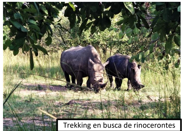
Trekking en busca de rinocerontes

Además de rinocerontes, este santuario se caracteriza por albergar en sus llanuras animales como oribis (pequeños antílopes), cobos de agua y un sinfín de aves.