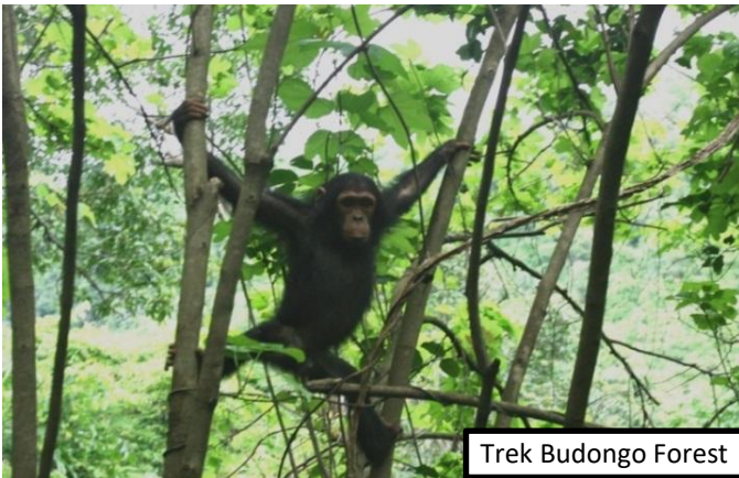
Trek Budongo Forest

- Budongo Forest: se trata de una caminata fácil de unas dos o tres horas de duración aproximadamente y sin desniveles que realizaremos acompañados de un ranger. Nos encontramos en un bosque tropical, el mayor bosque de caobas de toda África del Este. Podremos también ver, entre otras especies, varios tipos de colobos, multitud de aves y una gran variedad de mariposas. Imprescindible llevar impermeable y botas de trek. Los permisos para ver a los chimpancés son limitados, ya que para una correcta interacción con los animales se dosifican mucho las entradas al bosque. Nos adecuaremos a los horarios que tiene la reserva, de manera que el grupo podrá ser dividido en varios grupos.