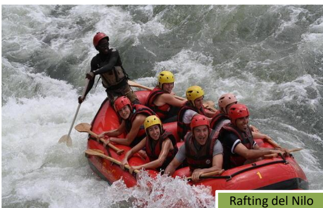
Rafting del Nilo

En 1857 Richard Burton y John H. Speke se embarcaron en una de las expediciones más ambiciosas y románticas de la historia: la búsqueda del nacimiento del Nilo. No fue hasta 1862 que Speke llegó a ver las fuentes describiéndolas como “el espectáculo más bello que vieran sus ojos”. Durante nuestra ruta, el Nilo nos acompañará en su paso por el Parque Nacional Murchison Falls y seguiremos su curso hasta el Lago Victoria, en Jinja. Este poderoso gigante será también nuestro campo de juego, ya que en sus aguas tendremos oportunidad de realizar uno de los raftings más famosos del mundo. Los rápidos de este río harán que descarguemos toda nuestra adrenalina y nos sumerjamos en unas de las aguas bravas más impresionantes del planeta. Además, podremos hacer muchas otras actividades, desde kayak en el Nilo, ir en quad o en mountain bike, hasta montar a caballo o simplemente descansar contemplando las preciosas vistas que nos rodean.