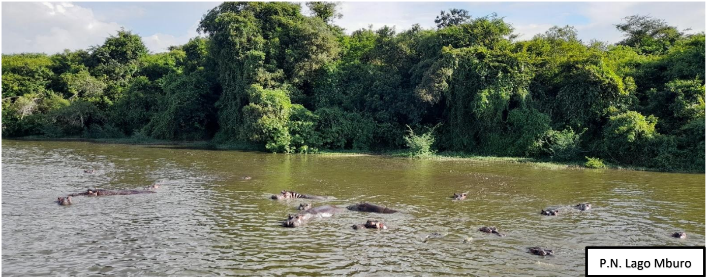
P.N. Lago Mburo

El Parque Nacional del Lago Mburo, ubicado en el suroeste de Uganda, es un refugio de vida silvestre que ofrece una experiencia natural excepcional. Con una superficie de 370 kilómetros cuadrados, este parque es el más pequeños del país, pero su riqueza natural lo convierte en un destino imperdible para los amantes de la fauna y la flora africanas. El corazón del parque lo conforma el majestuoso Lago Mburo, rodeado de una sabana salpicada de acacias y arbustos, creando un paisaje idílico que alberga una gran variedad de animales. Entre las especies más emblemáticas se encuentran las cebras de Burchell, así como jirafas, impalas, búfalos y antílopes. El parque también es hogar de una rica avifauna, con más de 350 especies registradas, incluyendo flamencos, pelícanos y una gran variedad de aves acuáticas que aprovechan los humedales y las orillas del lago. Además de su encanto paisajístico, el Lago Mburo invita a vivir la experiencia de un safari a pie, donde podrás contemplar la grandeza de su fauna en plena libertad. El parque cuenta con una red de senderos bien mantenidos que permiten explorar el paisaje de cerca y observar la vida silvestre en su hábitat natural. El Lago Mburo es un destino ideal para aquellos que buscan una experiencia africana más íntima y relajada. Su tamaño reducido y su menor afluencia de visitantes lo convierten en un lugar perfecto para apreciar la belleza natural del país sin las multitudes de los parques más grandes.